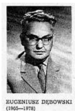
EUGENIUSZ DĘBOWSKI (1905—1978)